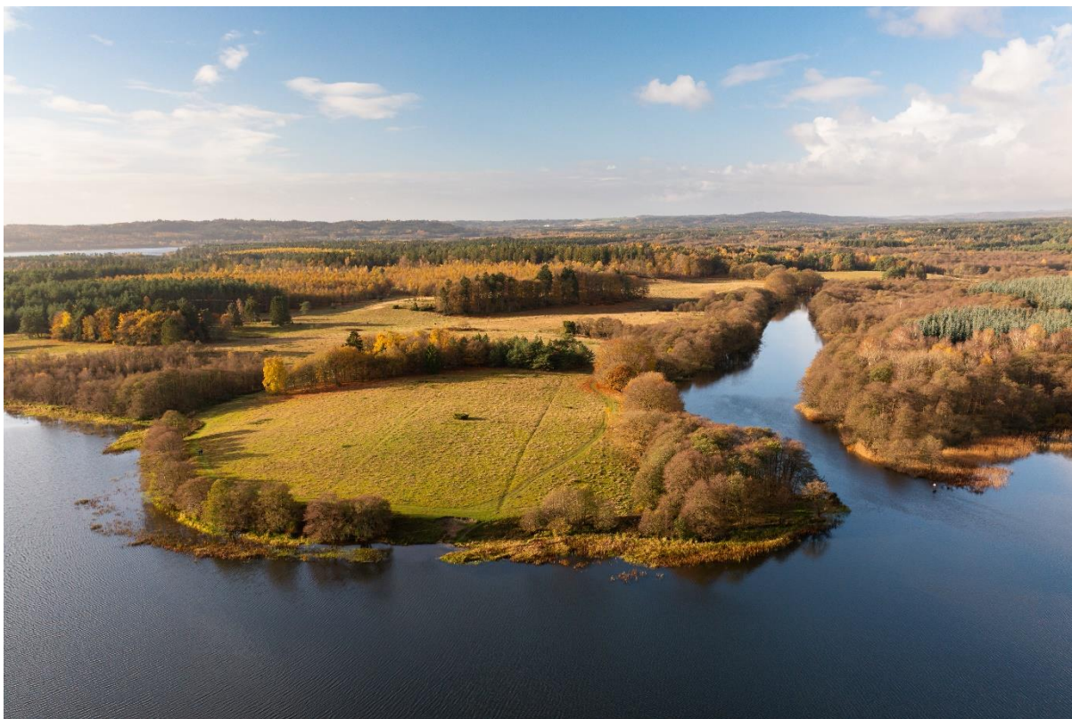
Gudenåens udmunding i Gudensø med det store statsejede overdrevslandskab ved Dalgård og Odderholm.

Der kan være indsatser i Natura 2000-planens indsatsprogram, hvor der ikke er samme klare geografiske afgrænsning. I denne handleplan er der en naturlig ansvarsfordeling ud fra den geografiske afgrænsning, og dermed hvilken myndighed, der er ansvarlig for gennemførelse.