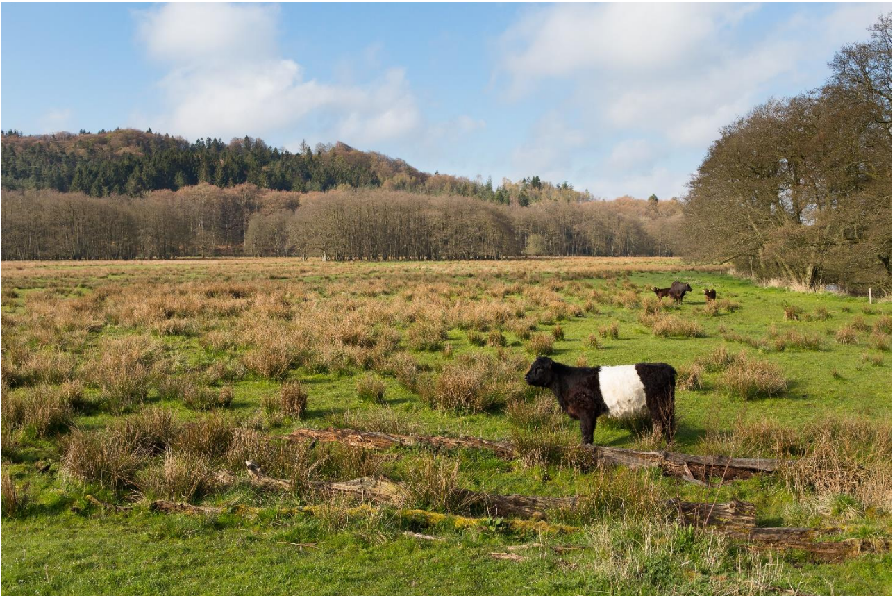
Græssende gallowaykvæg i Klosterkær ved Mossø.