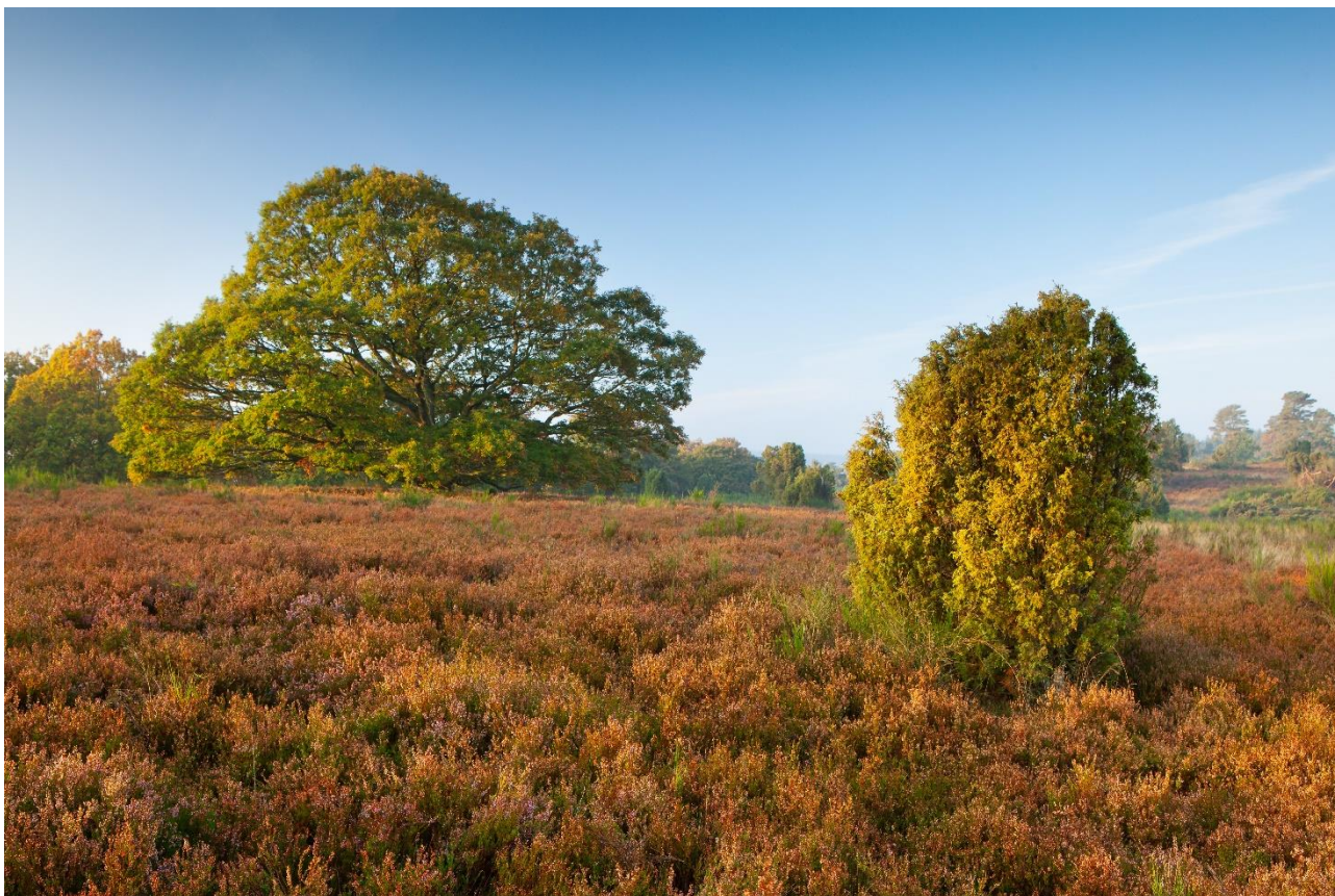
Tør hede med spredte egetræer og enebuske ved Salten Langsø.

Indsatserne på de lysåbne arealer vurderes ligeledes at være til gavn for de arter der er tilknyttet habitatnaturtyper. Der lægges bl.a. vægt på, at der på hede- og overdrevsarealer efterlades buske til f.eks. rødrygget tornskade.